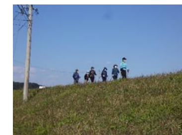
【ウォーキングの様子】