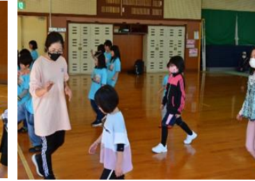
【ヒップホップダンス】