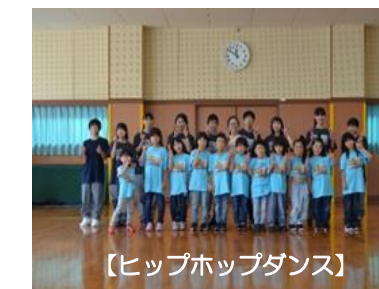
【ヒップホップダンス】